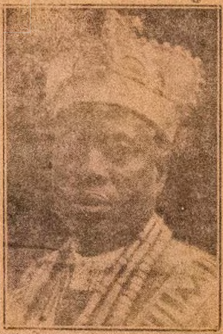
OBA ADELE II

Oro ti nwon fe so ejo lo lori nisisiyi niyi, Omo Oyekan gegebi Olori fun awon omo Dosumu so pe Iga Idunganran je ini ti baba won Dosumu, sugbon Adele gegebi Olori fun awon omoba yoku so pe npe ni nwon fi Iga Idunganran le Dorumu lowo fun itoju.