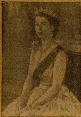
QBA OBINRIN NŞAISAN

LONDON: Irohin ta si wa leri wipo Elizabeth Keji Oba Gesti nşaisan şşan'ri şşoşo işş fi o nşisi se ni akoko yi oko re ni yio se. Awon onkşşo pe wahala ti o se pipo nile Scotland ati lita ajo ojo mejji ti o ris ollu kan ti nwon ape ni Liscolashire lo fa sşlers na wa.