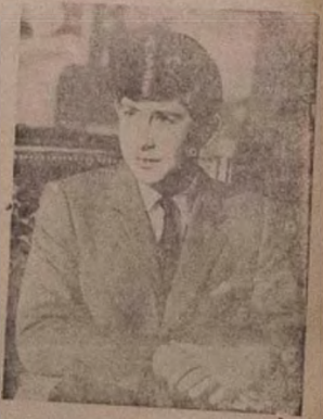
Eleyi ni aworan ti Omu Oba ilu Oyinbo, Charles ti won npe adapo oruko re ni Omu Oba ilu Wale 555 gba laipe yi