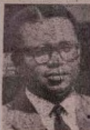
Chief A. Enahoro

pa (House of Lords) sugbo awon ogunnagbo egbe a ajo na ti fomu wipe ki ejo na ko duro nibiti awon gbe da a si yi.