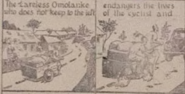
The Careless Omolanke who does not keep to the left endangers the lives of the cyclist and