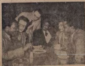
Awon ti a wuo ninu aworan yi ni awon omo ile Nigeria ti o lo fun eko loisawaju nla Oyibo.