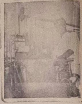
Eniti a nwo sileu aworan yi ni omo ti Ghana kan ti o njo Ogbesi Elogmas, ko dagba ju omo egan edun lo ti o fi lo ko ipe bi a tere nje iwe zilu oyinbo. Eto itewa na ni o mu dan ti a nwo yi.

Omo Ti O Nko Ise Tewe-Tewe Ni Iliu Oyiabo.