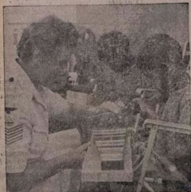
Awon obinrin Gesi ti o nsiye ninu oko ofurufu ti o nja ogun, ni a nwo ninu aworan yi, nibiti nwon ni omi gbigbona (tea)