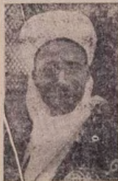
Alhaji Sir Abubakar Tafawa Balewa