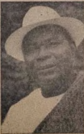
Chief F. S. Okotie Eboh