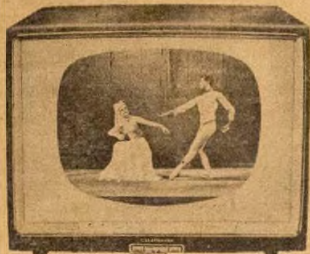
TELEFUNKEN TELEVISION SET