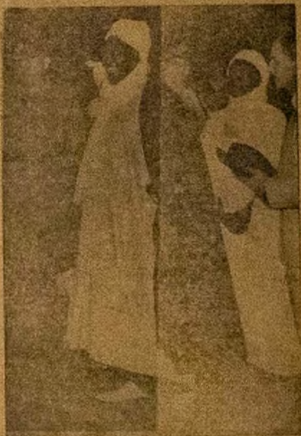
ELETI OPE ILE HAUSA

ILORIN. Ijoba Ile Hausa ni a gbo wige o ti igbimo ibile Ilorin ka ni ojo Monday na ni ilorin ni awon ilorin na ni July, 1958. Awon egbe Tolaka Pelepo ti o ni ni egbe Afesilere (Action Group) ni awon ilorin ka.