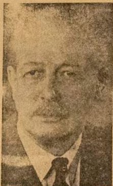
OGBENI HAROLD MACMILLAN

Eniti a nwo ninu aworan yi ni awon igbimo ilu Oyinbo bere lowo re, bi o ba gbo nipa etu Oloro ti awon Faranse fe ju sinu okun yanrin Sahara. O dahun pe beni, on ti gbo. Ko nse etu oloro ti H. Bombu ni nwon fe ju, eyiti nwon fe ju ko lewu rara.