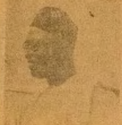
OLOYE OBAFEMI AWOLOWO ALAKOSO IWO-ORUN