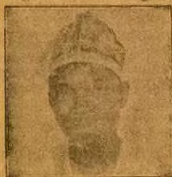
DR. NNAMDI AZIKIWE ALAKOSO ILA-ORUN

laisi ani-ani, ijoba ominira ti gbo-gbo- gbo ti a nijadu fun ile wa, kelele ni yio to si wa igwo laiko ni si gbon'ni si omi koto.