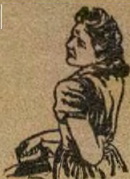
A 44 DE WITT'S PILLS

Egbogi De Witt je egbogbi ti a ti n'lo l'ati a'iyere wa, ni o fi di omi yi ko wa b a w'wo ehin didun san ti egbogbi e'ha ti o ti lo De Witt lo n'kan sara si fun j'ije bi idas re. N'itori kil'eyi, ogunlogo l'wa ni awon ko j'ow' s'awa lati ti dup'e fun ore rib'ribi ti De Witt n'ee fun w'wo. Lo si le ti ita egbogbi ki o lo re t'ise l'oni fun l'ilo n'itori i'afara l'owa.