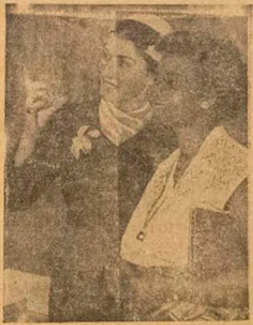
Awon enia meji ti a awo ninu aworan yi ni awon arewa meji Miss Ghana ati Miss Britain.