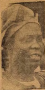
Eniti anwo ninu aworan yi ni Oloye S.L. Akintola ti ise Premier agbegbe Iwo-

Esq ghogbo awon alase ati oselu agbegbe Iwo-orun ni o pe ju-pese sibe.