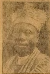
OBA ADELE II