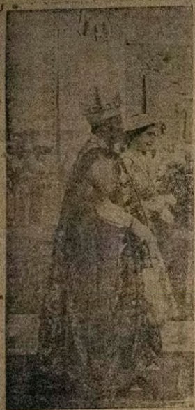
Aworan ti e nwo yi niti Alaiyotuzawa oba obinrin Eliseboh keji pelu oba Adeniji Adele, keji ti ilu Eko ti ipe Alakoso, ile igbimo otutuju ilu Eko ni gbangba - teju ayida-ona ni Ite Yaba ti a npe ni Yaba Round-about.

Nibe ni oba Eko ti duro pe- de oba obinrin ilu Oyinbo po- lu olojutulo olo ni o'olu tayo- tayo ki awon ba sio - sinu oro ni Kabiyesi so ni Ojo ni si, o ni nwo ba ojo ti ana igbe Gesi, ko felele ni agbala obo Eko ni leba lieba rere ti oba obinrin ilu Eko ni o'olu re, Eyi je olo keta ni August ti odun 1851.