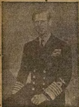
DUKE OF EDINBURGH

Ti ba wa ipo ti oloye ti Edinburgh ti wa lehin igbati Oba Elizabeth keji ti de ade, ati awon ise pataki ti o ti se ni idile Oba, a nilati ma ranti wipe sibebe okan ninu awon enia ti o wa ni abe abo ati idati Oba ni o je.