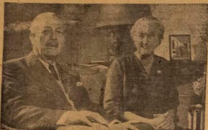
Lehia ti Ogbeji Macmillan ti wa be wa wajida Nigeria, o'atatare lo si Iba Gasa de Afrika tibi lo si ile Rhoads. A gbo wipe gbagbo'nye baba ti o rin lo'ofirin nja, re na'ije egbaa mejo.

EKO. Iroh'n ko to afoju ni Idumu ti o ba awon pa-rapana, nighali awon gba ipe wipo, g'abo ile Ifiwe - ranso (Post Office) lo ma fe jona kanta.