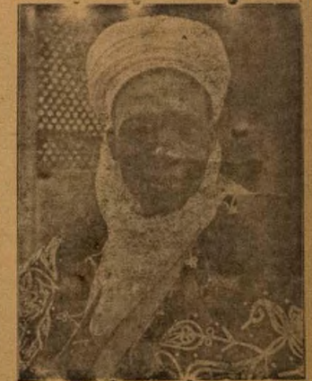
Irohin te wa lowo lati ilu Oyilabo wipe nwon yio fi Alhaji Sir. Abu Bakare Tafawa Balewa, ti oje Prins Minister Nigeria ati Ogben kan ni Amerika ti awa re ni Sir Roger Makins je oye amodin (Doctors of Law) ninu ile eko Sheffield University London, ni ojo keria osu May, 1960