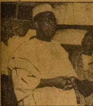
Oloye Obafemi Awolowo se nilu Ibadan pe mo ki gboḡbo