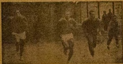
Awon]ti a nwo yi ni awon osere ilu Nigeria ti o lo bi won ni idarawo wa idarawa ninu Cardiff. Nigbati awon da ohun awon ko fe loko, tataro ni awon se bore l'ere ninu fun idarawo. Oloru wa ninu won, Odofin wa ninu ni Olofinwa ni ninu pata.