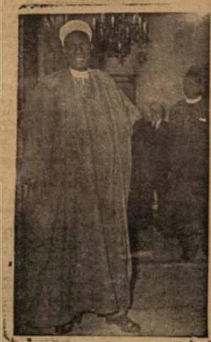
Mo ti gbo pelu owariti ati ibanuje irohin baru'u nipa iku Ogbeni Lumumba. L'oruko ijoba ati awon enia ile Nigeria, mo le so wipe awa lodi gidigadi si ona irufe eyi ti buruku yi fi sele.

Ogn ile Nigeria fun awon ile ise egho (Company) ni wipo eyin ko ba se dele sika ki o ma n fihan Kota isegbe ise ba ti silp tabi ipade egho ile ise na ti won ba se, bi ile ise na ko ba bere ise tun odu kan ti nwon ti se jio tabi ti o ba da ise duro fun odu kan jio nlati da doro, ki wopo ti ile ise na.