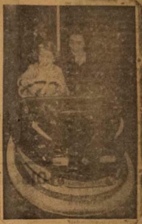
Omokere ti loke ni ebe ni si a man of the evening at the Omoba Anso, Omokere ti oja Gadi ni so Fo loko wipa Mota Jangiroba pelu Olatun re nigbati awon lo wacan ni Bartram Mills Circus ti awon oje ni lu London.