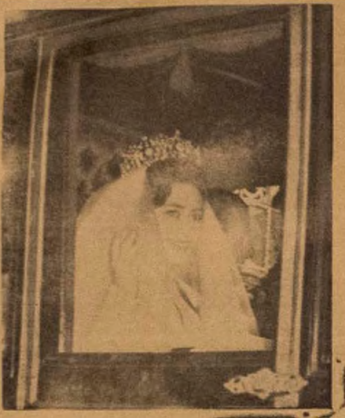
Awon ti a nwo n'ou sworsa yi ni oko iyawo Anthony Armstrong-Jones ati iyawo re Princess Margaret, wuu soo arade, nigbati wwon aho gba oruka silu Westminster Abbey, Sofo ti o tobi to o si dara julo ni ilu London, sinu moto onijiji faaji. Iyawo a towo b'osun o.