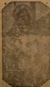
SIR AHMADU BELLO