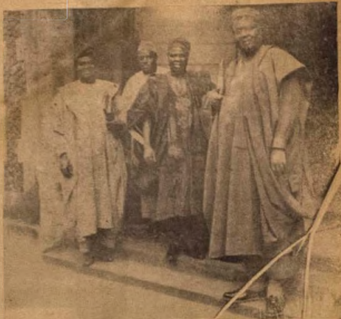
Awon ghasumo ena ti nwon lo sila Oyinbo fun eto ipela ominira fun Ile Nigeria ni a wu nina aworan eke yi.