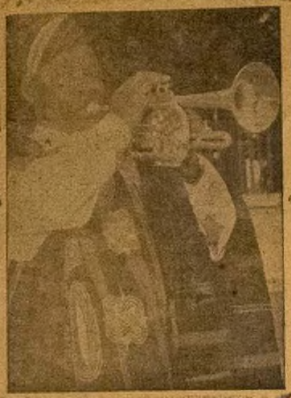
Eniti a owo nla aworan yi ni Ogbeni Hamid. R. Oszona - emo lru ibiti ti olokuta ati Fere korin ni lu Oyinbo. Nwon pa laye lati wa aso ile wa aso-Oke nla u lu ikose orin na.