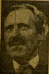
SIR, MORTIMER WHEELER

Bakanna ni Sir Mortimer yio se alaye oro ni ilubadan Enugu, ati Kaduna. Nile Ariwa, Oke-Oya ni yio gbe lo ojo mefa ti o k u fun u ninu abewo ose meta ti o wa se nile Nigeria.