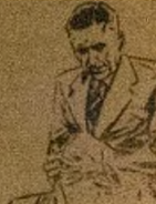
— NI—WON KO SE NI EŌIO