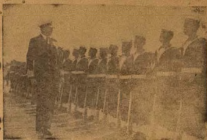
Awon omo ogun oju omi ti a nwo ninu aworan yi, ni awon omo ogun ile Nigeria ti nwon nise ninu oko ogun H. M. N. S. Nigeria. Gbogbo awon jagunjagun naa oko na fere je soia dudu ara ile Nigeria ayafi awon die ninu won ti o je oga lo Oyombo. Wo gbogbo won be awon ti doro sanian ti ogabo (Commandant) si nye imura won wo.