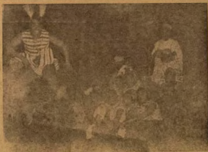
Okunrin ti a nwo ti o dabi egungun nina aworan yi, je ara agbegbo Ila-Orun ti o njo lra ijo kan ti nwon npe ni Ijo Atilogu.

Ijo na fere ljo ti Yoruba kan ti nwon npe ni Ijo Bata (jokijo ni Ijo bata, sibon nigbati awon opo enia ba njo Ijo Atilogu, nwon o ma fi lau ka isise won, nitaripe ki awon le mo skoko ti nwon ma gbera so ati ki nwon le jo Ijo na daradara.