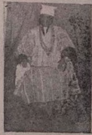
OLOYE AMINU KOSOKO (Aaju Oloja Ereko)