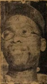
Olopa Awolowo lo fi ipin lu awon ala-kan ti a npe ni Liberty Stadium lara.