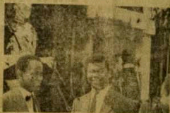
Lododun ni U.A.C. na nkan awon emu Nigeria lo si ilu okere lati fi fun awon non bi awon ba le mo bi a ti nsowo jere. Eyi a si ma ni U.A.C. ni £50,000 lododun.