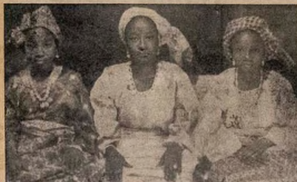
A gbọ tawon eloyi ti nwon ki se ELEHA, tawon iya wpon nko?

Ni oṣe ti o kọka ni mo ti fe gbe oṣo mi yi jade sugbon iwe kan ti Ogbeni kan ti o nje Ologbon ni Tototo ni Ago Owu, l'Abekuta ko si mi ni ko je, mo si ro wipe gbogbo yin ni e ti ka oṣo baba Ologbon na ti o so nipa IYO oṣe ti gbogbo wa nje lojojumo.