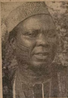
Oloye S. L. Akintola

Ni akoko ti awon akania ni ile Yoruba ogunlogu awon enia ni nwon ko jeki awon akowe aka enia ka awon. Opolopo awon enia ni awon mbiau ni gbana wipe kiini awon fe ka awon si.