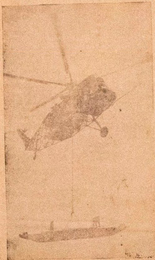
Iru oko ofurufu ti a nwo yi ni a npe ni Helicopter. gbogbo ara re je kiki irun, nwon nfi agbara oko ofurufu na han, gegebi