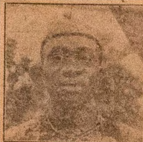
Alaiyeluwa Oba Olowo ti