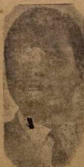
Oba Sikiru Adetona

ABEOKUTA. Kotu Ila Abeokuta gba wipe ki a di oye ije ti ila Ijoba-Ode duru lati gbo greebi Ijoba Iwo-Orun ilse nilati ko lati fi Oba Sikiru Adetona je oye Awujale.