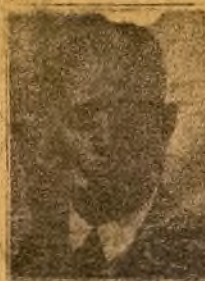
Eniti a nwo yi ni Ologbo