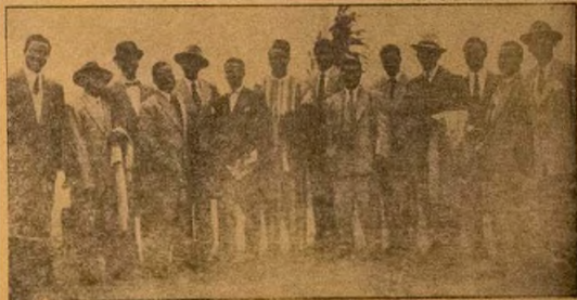
Awon ti a nwo ninu aworan yi ni awon omo ile Nigeria ti o ni ba won se ere Olympic nilu Melbourne ni osu November 22nd, 1956. Awon enia unwoyi ti wo oko ofurufu lo si ibi ere na nisisi. Oko Oba Obiurim Duke of Edinburgh ni yio si ibi ere na. Adura wa ni pe ki Olorun jeki unwon ba orire pada wa sile.

E Ma Ka Iwe Irohin Eleti--Ofe Ki E Si Ma Polowo Oja Yin Siuu Iwe Irohin Aladun Yi.