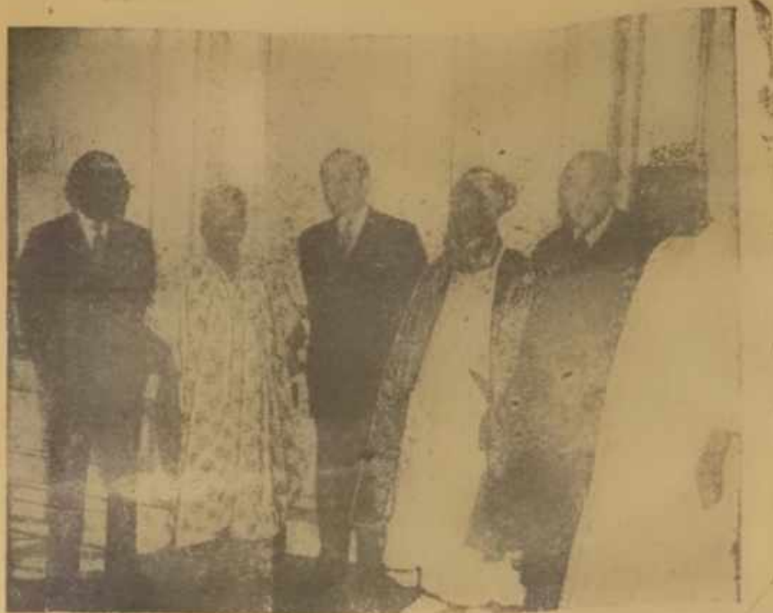
Awon ti a nru ninu aworan wanyai ni awon Asiwaju Ile Nigeria ti y'a sin ile wa de Ominira. Oruko won ni wanyai here lat: Sir Allan Cunningham Boyd, A'hoi DR. E. M. L. Endeley, Oloye Obafemi Awolowo, Sir Allan Cunningham Boyd, A'hoi Sir Ahmadu Bello, Sardana Sokoto, Sir James Robertson, G... aha ati Dr. Nnamdi Azikiwe.

Nigba taitai, ikoko kan wa ti a gberaga pupo gegebi opolopo enia ti nse. Ni ijo kan on ti imu tinte ni behe odo kan o nse ohun ti on yio je kisi... egungun, gran ti o ra labi njeju onje, nitoripe ehu npa nighana li o ri Salibata meji. Nighana ni o wa ni fun ara te hayi wape "ari mi ma dara O kiko joko lati ronun fun igba diẹ lehinna li o sa gbogbo egungun ti o ti ri li eti odo jo Nighale ile si su, o ti o pe awon egun ilon ti sa ti to fun ohun ti on le lo woyun. O nfi okun le ori ekeji o si to won jo titi won' figa ti o si o si dabi pepele petesi olake meji. O won yaurin lufun lati eti odo so ara pepele yi lehinna li o wa mo pepele kekere miran le li ori ti akoko. O si fi erupe papa lati iau odo bo o nighana li o so aw, o aloku salubata na mo eti meji o si ogun ori pepele lo lati joko, o nwo odo na yika pelu igberaga, sugbon ohun ko mo wape omogbo li on.