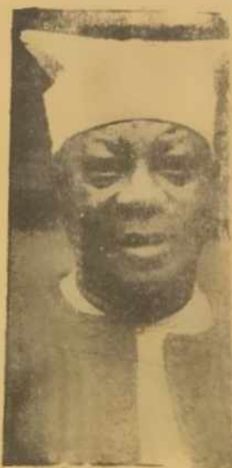
Eniti unwo ninu aworan yi ni

Ogbeni Amusa ghadere ti o je orori awon unye Akari here. Ti ilu Eko ti se je akan ninu awon oloredo ti o gba ghan Oloye ilu Eko