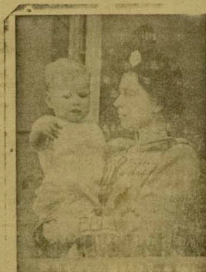
GHANA - Ni ibudo eke Ofurufu ni ejo Alalusi nigbatu eke

ti Oba Obaria ati Oky re; lat ilu ni London ganye s. Gha. a ni eka ko lohin (kanat ayo lati enu awon enia ti o ti bere si pe si idio lati oweri iil di osangangan.