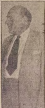
Ogbem Oliver Lyttelton

Ebiti awon igbero lati fi ipopo re fun ise Alamojuto na ni Ogbem Lennox Boyd eniti o wa ni aye "Transport and Civil Aviation Minister" nisisiyi, o si dagba to eni odun mokandinlajota.