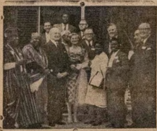
Awon ti o awo awon ti awon ti lo si lighing gboogo agba- iye nlu Oyinbo. Oruko won niwon yi Lati Owo O...