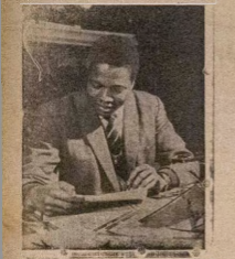
Eniti a wo ninu Aworan ni Ogbeni ara Ilu Saro kan ti o lo ko ise Wonle-Wonle nilu Oyinbo, ti Grukog re ni Peter Square, on lo mbe igbu Idanwo F o t o yiya ati ilu Wapoo.