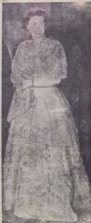
Aworan Alaiyelawa Oba Obinrin Elizabeth Kay tilla Oyinbo Gega pelu Olojaju Ojo re Omo b Philip ni a nwo yi sugoati o lo be ile ere nla (O Vic Theatre) wo nilu Oyinbo.

Alaiyelawa Oba Obinrin na lo ran Oloja-n Omoba Alexandra wa faju re nigba Ominra w tile Nigeria, ti Omoba Alexandra na si pada ile re ni alafia fowuro ojo Monday oge yi.