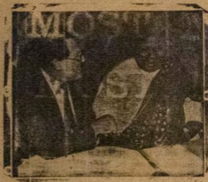
Ogbeni Reginald Maudling Alaga Ighimo Owo ti ilu Gesi ati Oloye Festus Okotie-Eboh Alase Ijoba Najiria nipa Ero Inawo, awon ni won ngbowo loyo ara won lehin igbati wo. Ti jjo fowo si iwe ti Ijoba Gesi si ya Ijoba Najiria ni adota oko meji pgunu. Ogun odun ni Najiria yio fi san owo yi pada.