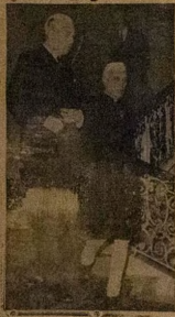
Awon meju ti a gbo ni waju aworan yi ni Ogbeni Harold Macmillan Olofin Ibe Gesi ati Jawaharlal Nehru ti je Olofin Ijoba ni India nigbati awon pari Igbimo ninu ipade egbo gbo gbo agbaye ti owuro.

won owo, o tun koju si won lekeji o si wipe Kila fa iya won ko dabun, ayafi igbati okunrin kan ninu awon ero iworan to tun mo re fun won.