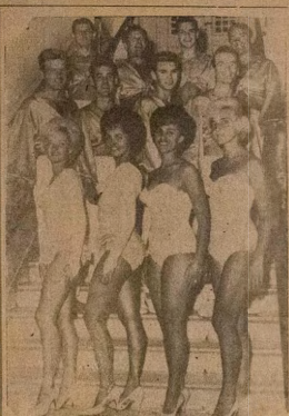
The Famous Zugspitze Acrobatic Troupe AWON GBAJUMO ELERE GELE LATI ILE JAMANI

WO AWORAN A W O N ALARAMODA YOKU LOJU EWE KEFA