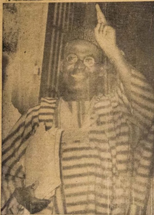
OLOYE QBAFEMI AWOLOWO

Ni oju keji oja keta odun 1963 oloye Awolowo ti o gheusogun fun ara re beje lati ma rojo fun awijare tire eyi ti o pari oro na ni oju kekandinugun oju Kerim odun 1963 oloye Awolowo si fi ye ile ejo de Igbimu WO OJU EWE KARUN