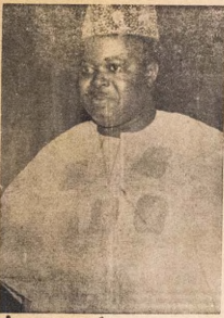
DOKITA M. I. OKPARA

Oloye Festus Okotie-Eboh Alakoso eto isuna fun Apapọ Ijoba si teie de si ilu Benin ki ipade egbe