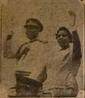
Dr. NNAMDI ASIKIWE ATI IWAWO RE

Dr. Nnamdi Asikiwe ti ise Ojola gomina Agba fun de Najirija ti o nso ajodun meju papo ni oju 16th. oju November 1961. Alakoko nina awon ajodun na ni pe Ojola Lak goko-aba, a di eni odun momadimofeta (57 yrs.) ati sere ni nipa agidan ra ni wipe, odu odun kan gba ko ti Ojola ra gun ori oju gomina Agba (governor general)