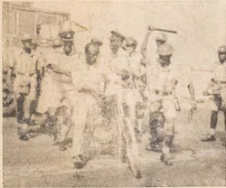
Aworan Oke yi ni ti igbati awon Olopa fi kondo awon dara si awon Osise lara nighati gbo gbo awon Osise nro bo wa si Eko lati pa laseko igbati awon Ebute - Metta

le fo daogwa sise kakiri-ari ile ise ni orile ede ile Najيريا ni awon Olopa soja mura lati le jeki alafia wa kakiri Najيريا.