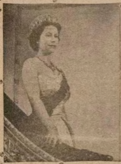
Eniti a nwo aworan re yi ni Alaiyeluwa Oba Gesi Elsbethi Keji, o duro lori ibi gbo gbo enia ti le ri, e o ri o mura, o niyo si Igbinu nla.

Nigbati o si di oyo keta ti a ti na ni mo ba bere si ke pe Olorun Eleda mi kẹkẹkẹ ni mu mi, mo nbe- be ki o ma sai doju ti Iwa yi, mo ni Olorun Oba ti o da aye ati orun, eniti onu ko le doju ko, jowo nna sai ran ogun orun wa ki won ran mo lowo lati le segun okunrin yi loni, mo ke kikanikan, Olorun si gbo adara mi, nigbati o to oyo kerin ti a ti nja ni mo sa gbe lo sibi stakun kan, nibiyi ni Itakan ko ni ese ti o si sibi, bi o ti sibi ni o npoka ike ti ko si le didi mo. Gbo gbo awon eranko, Iwa, ati abami e da ti o wa nibe fi arivo wa, won ni o se okunrin alagbara, Inu emi na dun, mo ju oyo si won, mo ni ki se emi ni mo se Olorun ni.