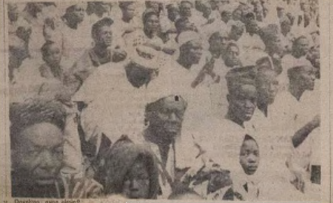
Ogundigbo awon elere...