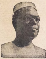
OLOYE QBAFEMI AWOLOWO