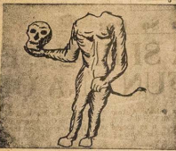
Esu re e! Bale Orun Apadi!!

Ekeji je awo ope. Owe (sikato awe loko iyan) ode ade egusi, owa fi yarin seti gbogbo re di siyisiki awo ekeja aje ti ope aparo-asepo mo ma, enyin oazawe mi si ti mo pe enia oha f'aparo