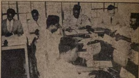
Awon Irijin ati saaju Igbimo Amuludagba ti Iwo-Orun nse Ijiridi.

9. Opolopo Ise wa ni awon olodun ero mba wa