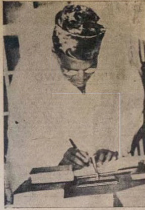
Oloye Obafemi Awolowo ni oju si iṣe adehun ase alakoso Ijoba Ipinle Iwo-Orun ni afin Gomina Ipinle Iwo-Orun ni Ibadan pe on gba on si pinni lati tun sin awon orile ede lilo on fun odun marun si i gbebi Alakoso Ijoba. Ki Olorun pelu re ati awon emewa re Amin.