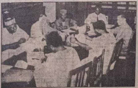
Awon Irijin ati saaju Igbimo Amuludagba ti Iwo-Orun nse Ijiridi.