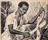
Ar re a mo a kan fun e eri ti o ba nita

Boya wa a gba lati se nikanran ti yio eto e ni odun moje tabi meta ki o to yanri. Ti nkan na ba jemo die tabi otan-isi, sara re. Ranti pe, o ni lati wa si ifofowawetu pelu eto ati pe ki o si ni irankoro ti o to ki o to ma a lo dawele otan-isi awon otan ti o ni eni (crisis) nima ipelata.