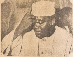
Dokita Jaja Wachuku

Awon kan tun nso ninu ege Alakuko pe bo Alhaji Ba ewa k o ba le le Dokita Wachuku kuro ni aye minista to wa yi, a jipe ija yiti wa lara awon omo ile Igbanjo aso-ila apajo Ijuba Najiria eyiti a ko le so ibiti o le yori si lehin ila. Awon enia ege kan si aso wipo, Balewa yenis papa, ko ni gbo nibiti yo gbe yo Dokita Wachuku kuro ni aye Wo Oju Ewe Kefa